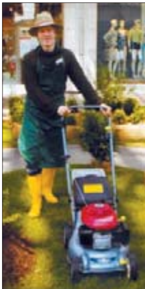
In Kleinformat geht's auch...