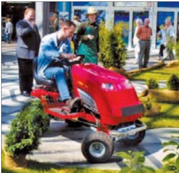
...allerdings macht die Gartenarbeit erst richtig Spaß, wenn es ans "Trecker fahren" geht.

Das schönste Geschenk? Kauft man sich selbst.