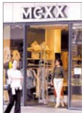
Mexx - seit dem Umbau neu im Center.