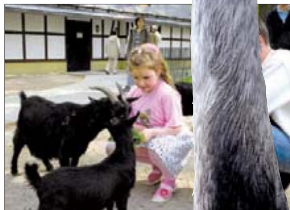
Erst in den Streichelzoo, dann ins Kinderparadies des Chemnitz Centers, das „KUDDEL DADDELDU“.

Tierparkes, Arche Noah e.V., mit dem Chemnitz Center zusammen. Auf allen Flyern des Vereins prangen Gutscheine für einen Besuch im „KUDDEL DADDELDU“. Zusätzlich wird im großen Spielparadies des Centers auf die Möglichkeit hingewiesen, den Kindergeburtstag im Tierpark feiern zu können. Bis zu sieben Freunde erfahren bei diesen Feten Wissenswertes über den Tierpark. Sie machen eine kleine Führung, sind bei der Fütterung dabei und erobern anschließend das Tropenhaus und das Streichelzoo-Paradies. Infos: 0371/8102500.