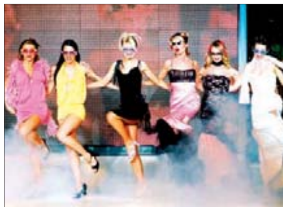
...die aktuellen Kollektionen der Geschäfte aus dem Chemnitz Center werden von professionellen Models vorgeführt und für eine gelungene Fete...