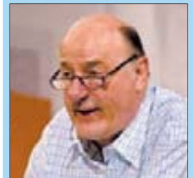
Manfred Krug stellte sein Buch „Mein schönes Leben“ vor.

Wenn Ulrich Mühe in Chemnitz auftaucht, ist das immer ein Heimspiel, schließlich hat er hier jahrelang Theater gespielt. Im Rahmen des Literaturfestes „Leselust“ gab er Passagen aus dem Buch „Der kleine Prinz“ zum Besten.