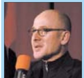
Ulrich Mühe las aus dem „Kleinen Prinz“.