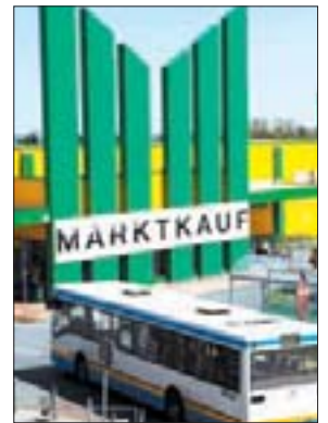
Marktkauf neu platziert.

Lange Wege sind seitdem passé. Zudem wurden die Fleisch- und Wursttheke perfektioniert. „Unsere Textilabteilung ist viel größer geworden. Zusätzlich bieten wir unseren Kunden ein neues Angebot an Schuhen und eine ausgebauter Verkaufsfläche von Tchibo an.“ Jetzt muss nur noch der Getränkeverkauf angekurbelt werden. Seit dem Umbau ist das Getränkeangebot direkt im Marktkauf untergebracht.