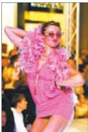
Knackige Mode für flotte Mädels - immer ein Hingucker...

Party beginnt dann zu späterer Stunde. Ab 22 Uhr wird der Catwalk für die Besucher zum Tanz frei gegeben. An den Plattentellern: Kult-DJ Dirk Duske. Gordon Knabe: „Riesige LED-Video-Wände und eine tolle Beleuchtung setzen alles so richtig in Szene.“ Kurzum: Die Fashion Party wird das Highlight des Chemnitz Centers. Eintrittskarten gibt es für nur sieben Euro an der Abendkasse.