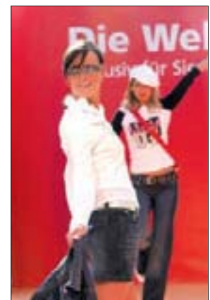
...sorgen jede Menge Showeinlagen.