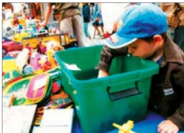
Stöbern und Verkaufen – all das können die Jüngsten beim Kindertrödelmarkt. Allerdings soll kein kaputtes Spielzeug angeboten werden.

Jedes Kind bekommt seinen eigenen kleinen Ladentisch – einen Quadratmeter groß und schön bunt mit Stoff bezogen. Standgebühren fallen nicht an. Auf die jungen Händler warten Zuckerwatte und eine Hüpfburg – natürlich ebenfalls kostenlos. Und anschließend können sie sich im „KUDDEL DADDELDU“ austoben. Anmeldeflyer liegen in allen Geschäften aus.