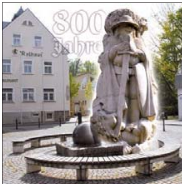
Der Röhrsdorfer Markt. Im kommenden Jahr ist hier richtig Bamule.

„800 Jahre Röhrsdorf - um solch ein Fest zu organisieren, da gehört einiges dazu. Vor allem müssen wir langfristig planen. Ohne Koordination und Organisation geht gar nichts. Derzeit sitzen wir zum Beispiel an der Realisierung einer Festschrift. Dann machen wir uns Gedanken über einen großen Festumzug durch Röhrsdorf. In Zusammenarbeit mit den Verantwortlichen der Festschrift wollen wir eine Bildabfolge für den Umzug vorschlagen. Wir rechnen mit etwa 300 bis 500 Mitwirkenden für die Umsetzung dieses Projektes. Eine gewaltige Angelegenheit. Alle unsere Vorschläge für die Gestaltung des Röhrsdorfer Festes liegen im Rathaus aus. Dort können sich Interessenten als Organisatoren eintragen oder ihre Ideen mitteilen.“