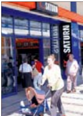
Der Saturn-Markt im Chemnitz Center

In Chemnitz fährt sogar ein Showauto vor