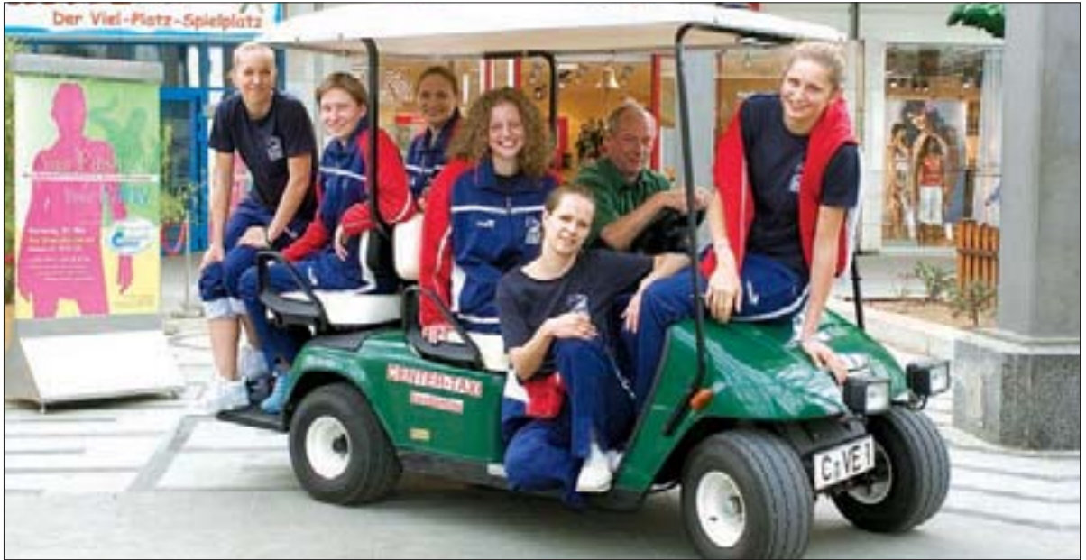
Riesenerfolg für die ChemCats: Sie spielen in der kommenden Saison in der ersten Bundesliga. Natürlich können auch alle anderen Besucher des Chemnitz Centers den Service „Center-taxi“ nutzen. Man muss nur die Augen offen halten. Der besucherfreundliche Caddy dreht seine Runden durch das Center.